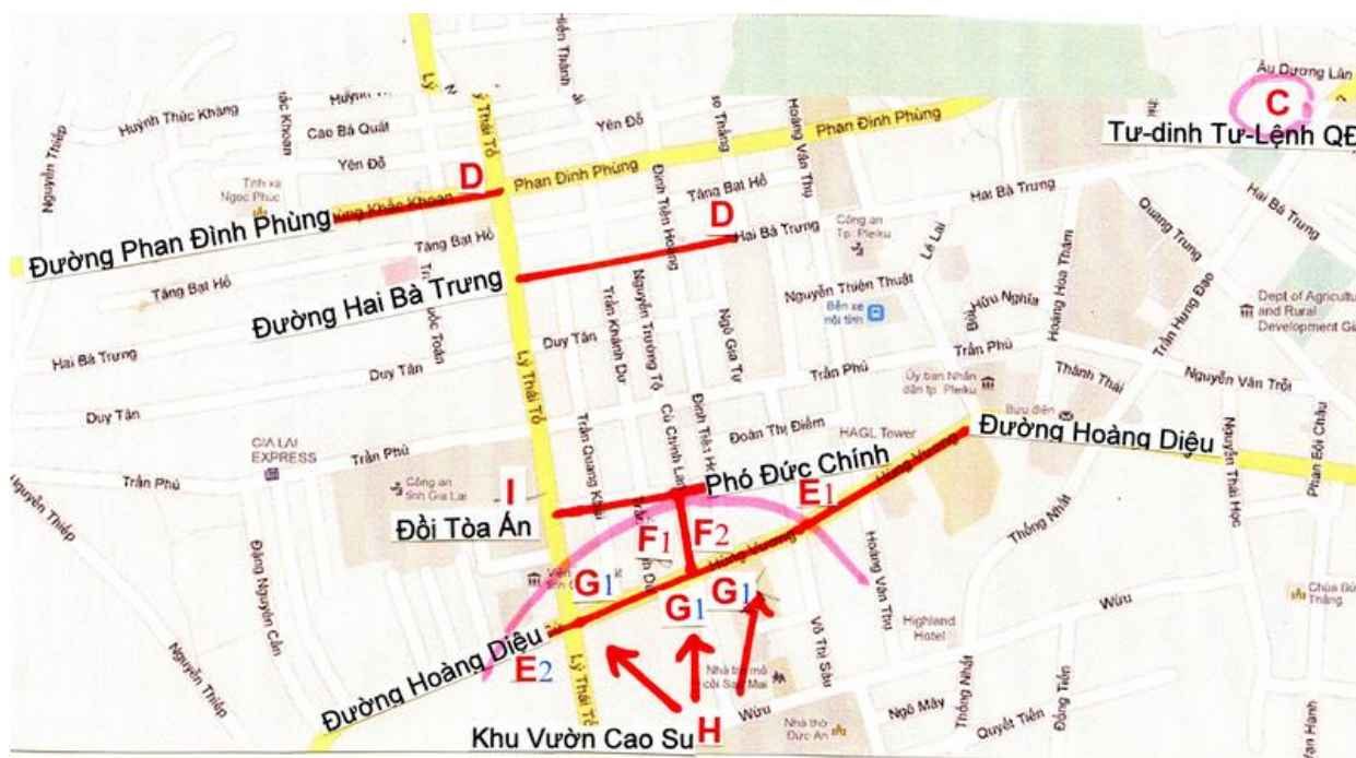
Bản vẽ này chỉ để minh họa mà thôi (không đúng vị-trí và khoảng cách)

TÔI về lập ngay một toán vũ-trang, nép sát lê đường tiến đến phía nhà của TT Khanh .