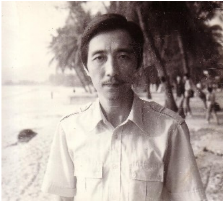
(Nha Trang 1986)