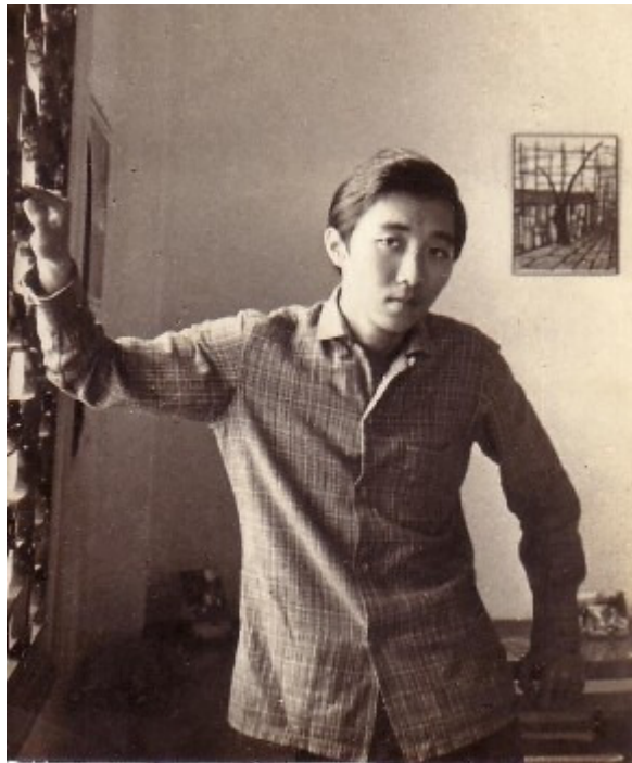
(Sài Gòn 1964)